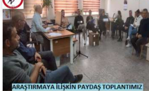
ARAŞTIRMAYA İLİŞKİN PAYDAŞ TOPLANTIMIZ

ÇUKUROVA REHBERLİK ve ARAŞTIRMA MERKEZİ, 2024-2025 EĞİTİM—ÖĞRETİM YILI ARAŞTIRMA ÇALIŞMAMIZ "ÖĞRENCİLERİN EVDE, OKULDA, ÇEVREDE VE SANAL ORTAMLARDA ŞİDDET ALGISI" Çukurova İlçe Milli Eğitim Müdürlüğü' ne bağlı olan; ÇAĞRIBEY MTAL, ŞEHİT ALİ ÖZTAŞ MTAL, VEHİ GÜZEL MTAL, NEZİHA YALVAÇ MTAL, ÇUKUROVA ELEKTRİK MTAL