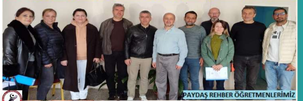
PAYDAŞ REHBER ÖĞRETMENLERİMİZ