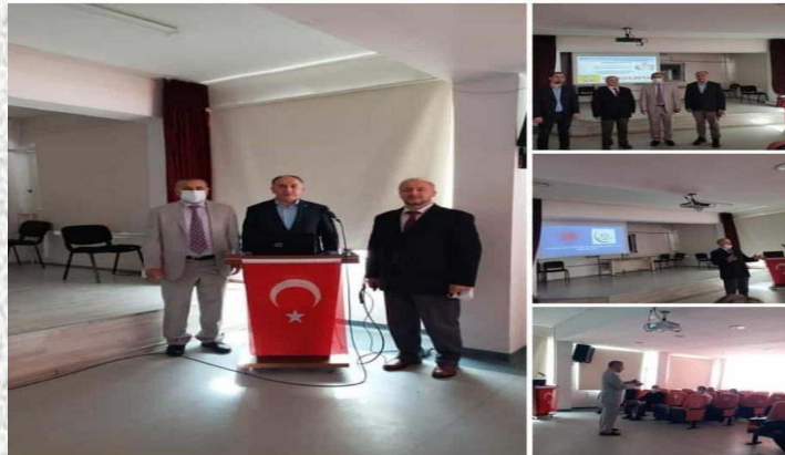
Vehbi Güzel Anaokulu

T.C. ÇUKUROVA REHBERLİK VE ARAŞTIRMA MERKEZİ; İlçemiz Vehbi Güzel Anaokulu velileri ve personeline yönelik "Mahremiyet Eğitimi, İhmal ve İstismar" ile "Adana Adli Destek Merkezi" konusunda seminer verdik. Bizi misafir eden okul yöneticileri ve rehber öğretmen arkadaşımıza teşekkür ederiz.