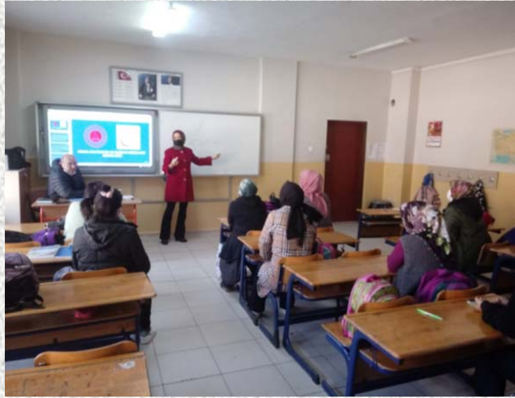
Kabasakal Şehit Selçuk Beki Ortaokulu