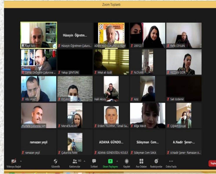
Akran zorbalığı konulu online eğitim