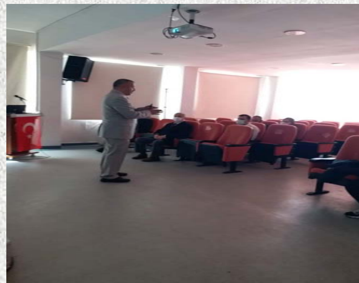
Gülbeyaz Güzel Anaokulu