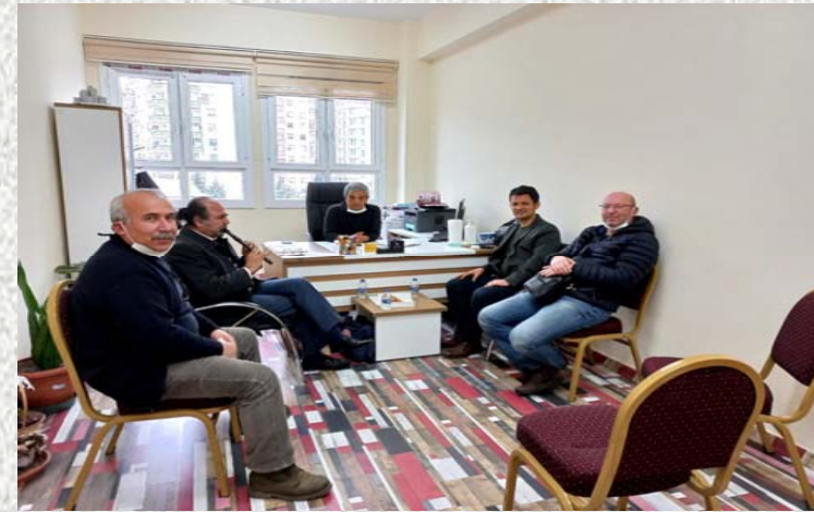
ATO 125. Yıl İlkokulu