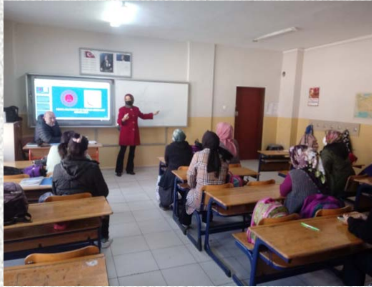
Kabasakal Şehit Selçuk Beki Ortaokulu