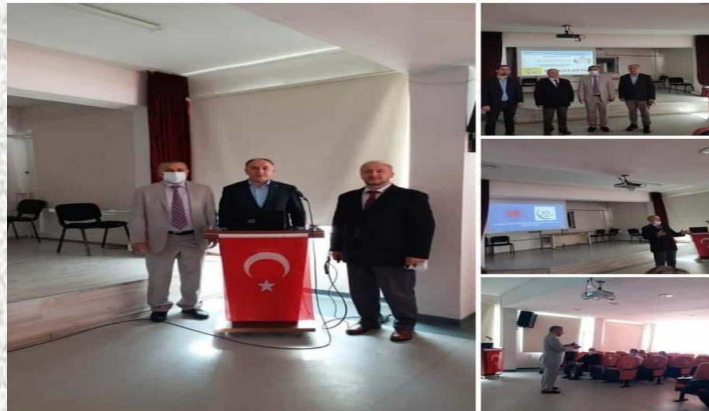
Vehbi Güzel Anaokulu

T.C. ÇUKUROVA REHBERLİK VE ARAŞTIRMA MERKEZİ; İlçemiz Vehbi Güzel Anaokulu velileri ve personeline yönelik "Mahremiyet Eğitimi, İhmal ve İstismar" ile "Adana Adli Destek Merkezi" konusunda seminer verdik. Bizi misafir eden okul yöneticileri ve rehber öğretmen arkadaşımıza teşekkür ederiz.